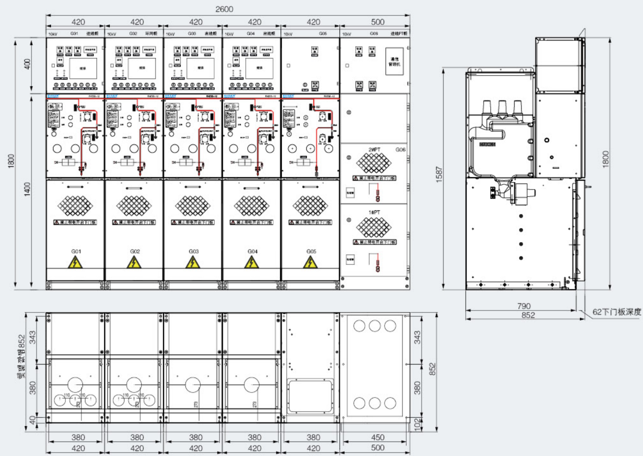
RXESS-12 系列固体绝缘环网柜典型方案